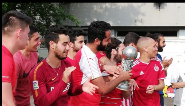
Teilnehmende Sportgruppe 2019

Kontakt: marburg.integrationstage@gmail.com