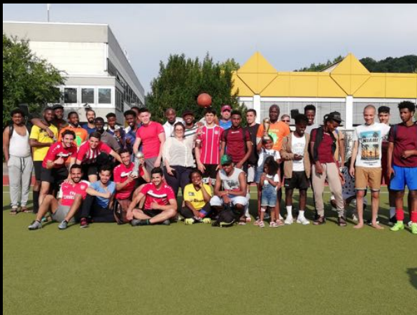
Gruppenfoto MATIS 2019